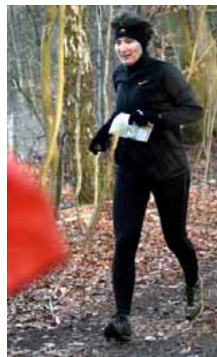
Pernille fra et af klubbens træningsløb