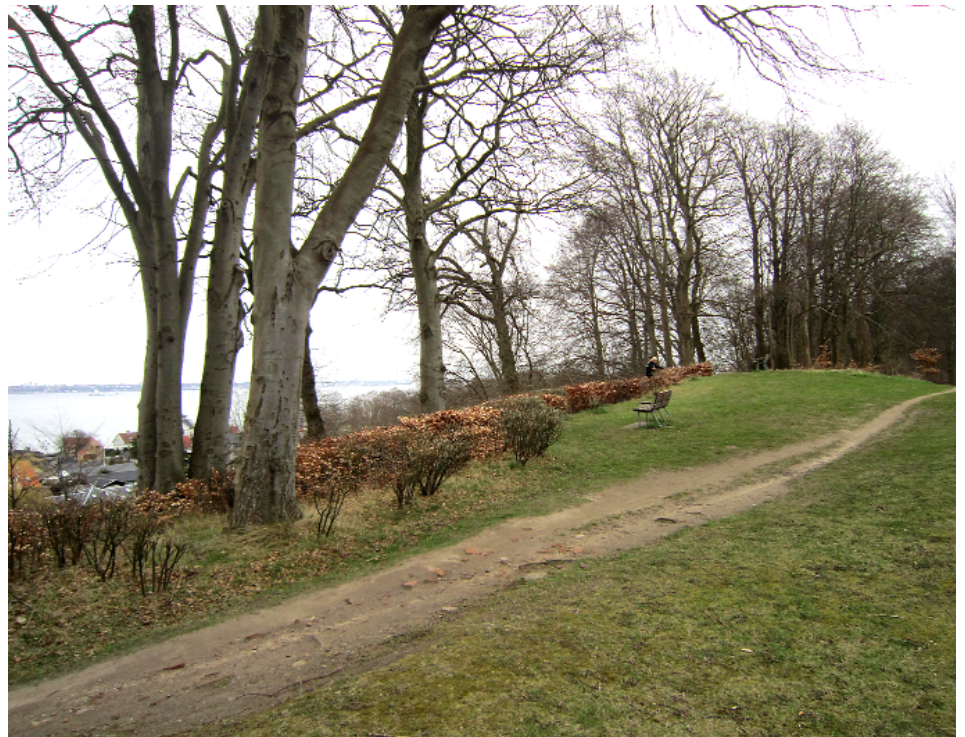
Hvor Birkehøj lå er der i dag et par bænke hvor vi en årrække kunne møde Jørn og Lis Utzon.