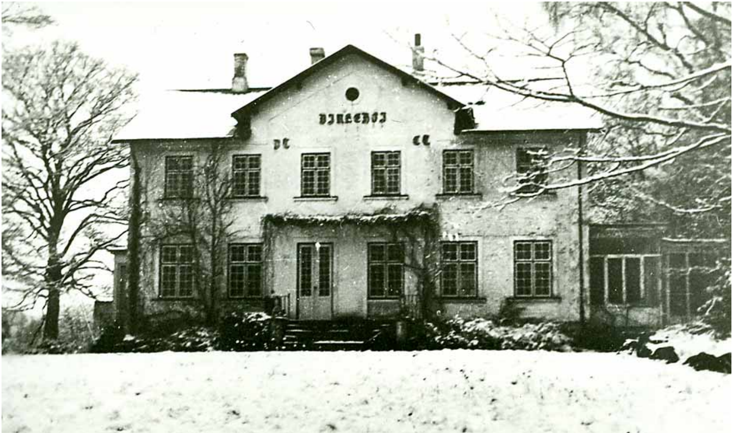
Foto: Det gamle landsted Birkehøj som jeg husker det.