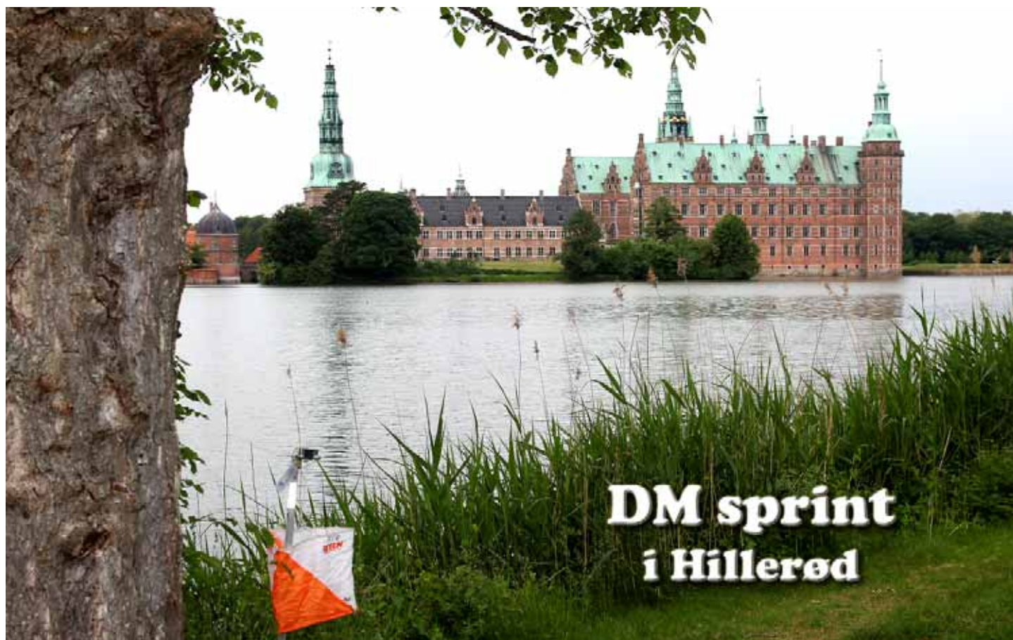
Finere rammer findes vel næppe til et O-løb