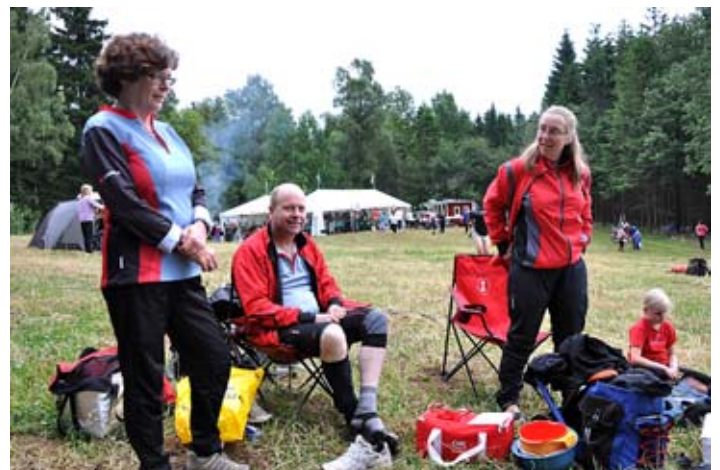
Fra samme stævneplads til Hallands 3 dagars.

ALLE TRÆNINGSLØB er med på AKTIVITETSLISTEN som ses andet steds i "Sokken" eller find dem på hjemmesiden www.hsok.dk/orientering