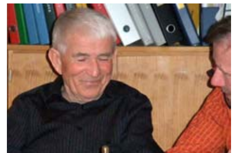
En tilfreds formand