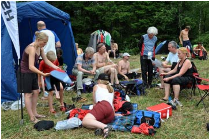
Stævnehygge til Hallands 3 dagars sidste år.

Hvis hele familien er indstillet på O-ferie er det en fantastisk måde at holde ferie på. Er man lidt alene med sin interesse, skal man nok ikke forvente at resten af familien gider at stå på en stævneplads den halve dag. I hvert fald ikke flere dage i træk. Min erfaring er, at efter en løbetur i hårdt terræn, og efter at have stået den halve dag op udendørs i enten solskin eller regnvejr - så er der ikke ret mange kræfter til at lege turist resten af dagen! Husk der er altid baner i alle sværhedsgrader.