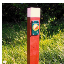
Eksempel på post