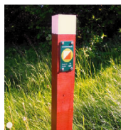
Eksempel på post

www.hsok.net E2.14 Helsingør Ski- og Orienteringsklub Egebæksvang Faste poster 2011